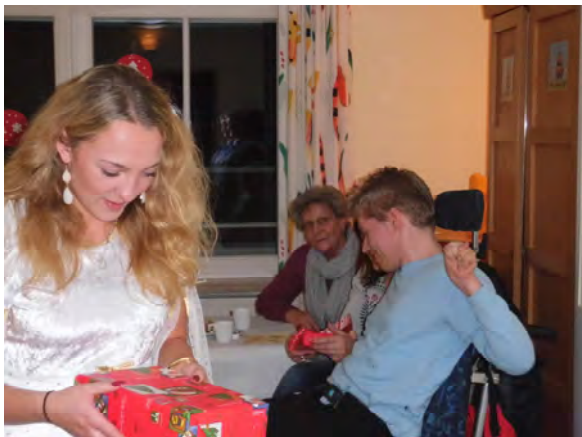
das Christkind übergibt die Geschenke