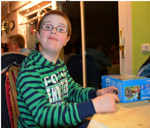
so sieht Kinderlächeln aus