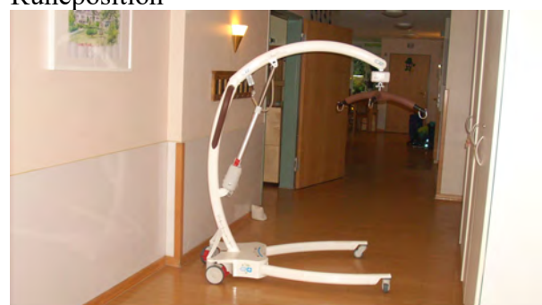
bereit zur Aktion