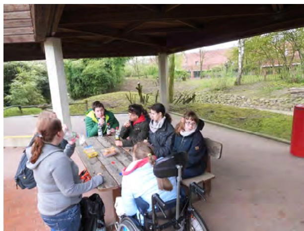
Pause beim Zoobesuch