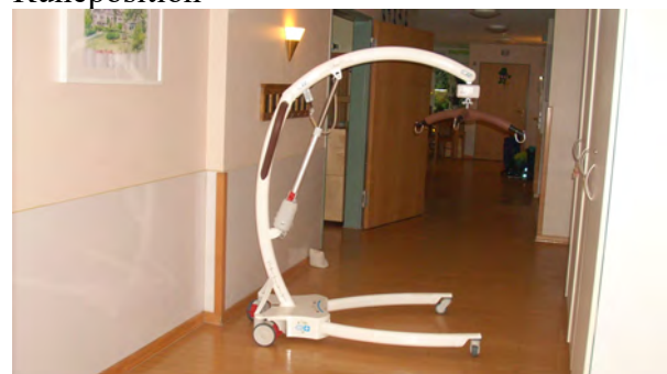
bereit zur Aktion