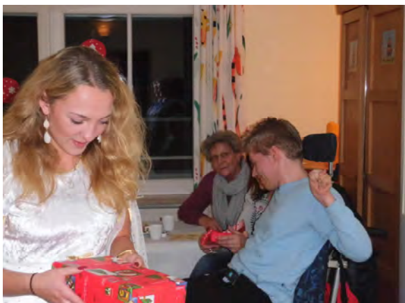
das Christkind übergibt die Geschenke